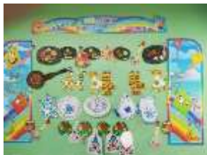
Стена творческих идей