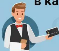
Схема мошенничества с банковской картой в кафе, барах, магазинах

Клиент отдает карту для оплаты в руки официанту (бармену, продавцу)