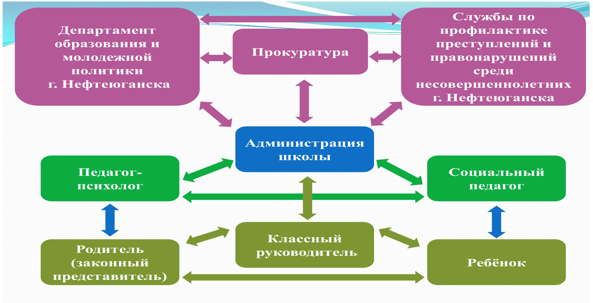
СХЕМА УПРАВЛЕНИЯ ПРОГРАММОЙ