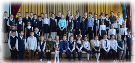
Участники конкурса художественного слова «Отголоски Чеченской войны»