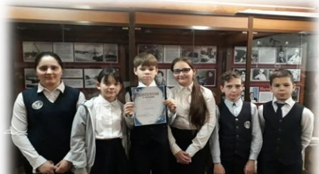
Победители городской викторины «Не ради Славы, а ради долга»

«И пусть поколения помнят» (сентябрь – февраль)