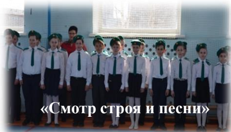
«Смотр строя и песни»