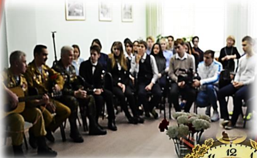
Встреча с ветеранами Афганской войны