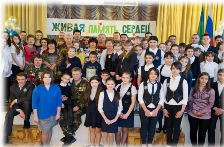
Вечер встречи «Живая память сердец»