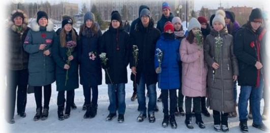
15.02. – участие в митинге «День вывода войск из Афганистана»