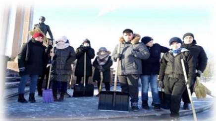
Уборка территории у памятника «Верным сынам Отечества»