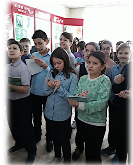
Уроки истории в школьном музее